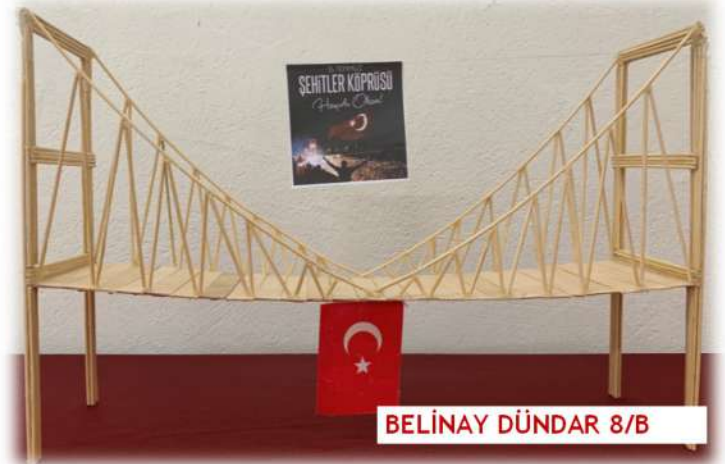
BELİNAY DÜNDAR 8/B