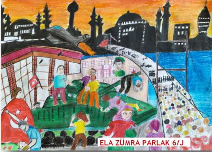
ELA ZÜMRA PARLAK 6/J