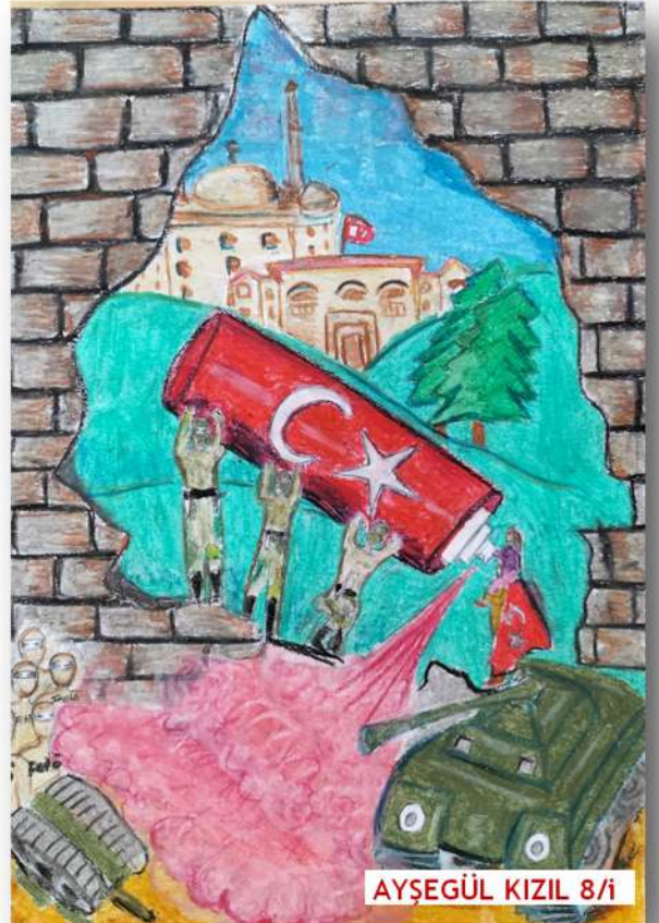
AYŞEGÜL KIZIL 8/i