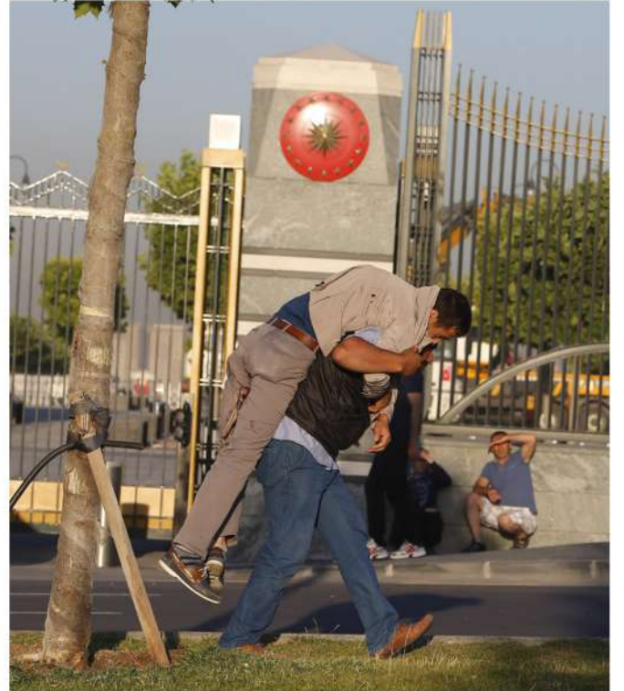
Röportajı yapanlar: Remziye URAL 8/H

Ben gençlere, öğrencilere öncelikle devletimizin verdiği eğitimi en iyi şekilde kullanmaları gerektiğini hatırlatmak istiyorum. Aklın, bilimin yolundan ayrılmadan her daim devletin ve milletin faydasına işler yapmalarını diliyorum. Gençlerimizin sorgulamalarını, bilinçli olmalarını, devlete ihanet içinde olabilecek kişi ve kurumlardan uzak durmalarını tavsiye ediyorum.