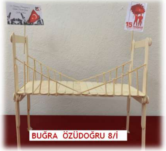
BUĞRA ÖZÜDOĞRU 8/İ