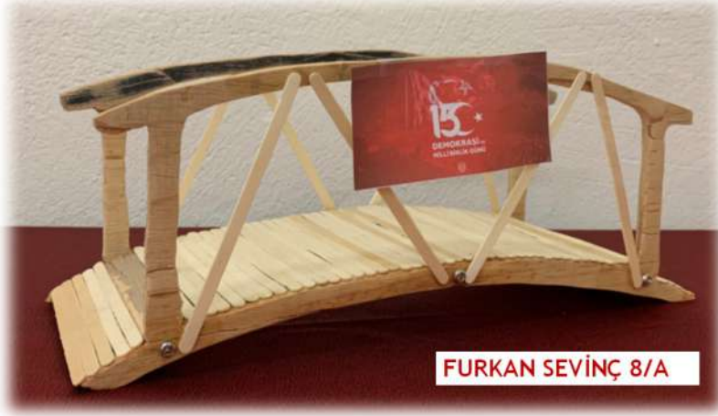
FURKAN SEVİNÇ 8/A