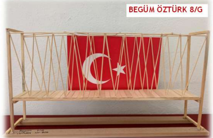
BEGÜM ÖZTÜRK 8/G