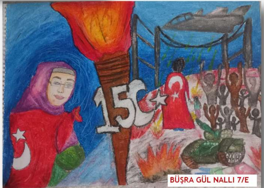
BÜŞRA GÜL NALLI 7/E