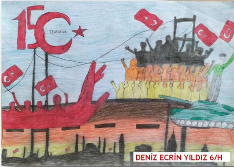
DENİZ ECRİN YILDIZ 6/H