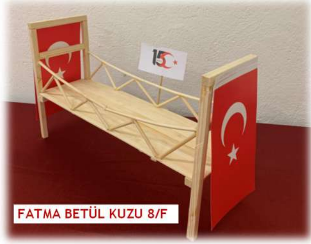
FATMA BETÜL KUZU 8/F