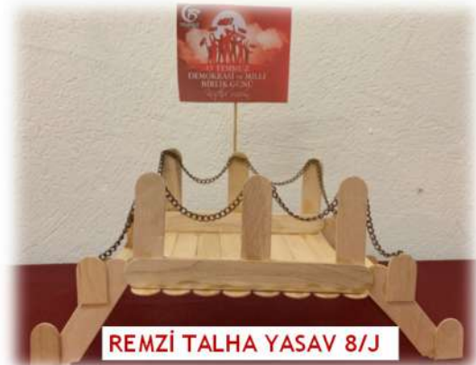
REMZİ TALHA YASAV 8/J