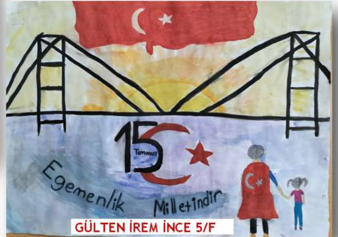
GÜLTEN İREM İNCE 5/F