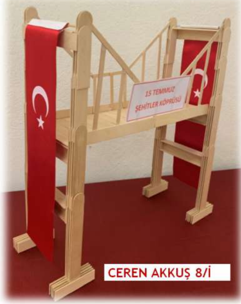
CEREN AKKUŞ 8/İ