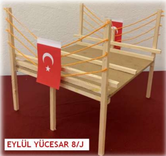
EYLÜL YÜCESAR 8/J