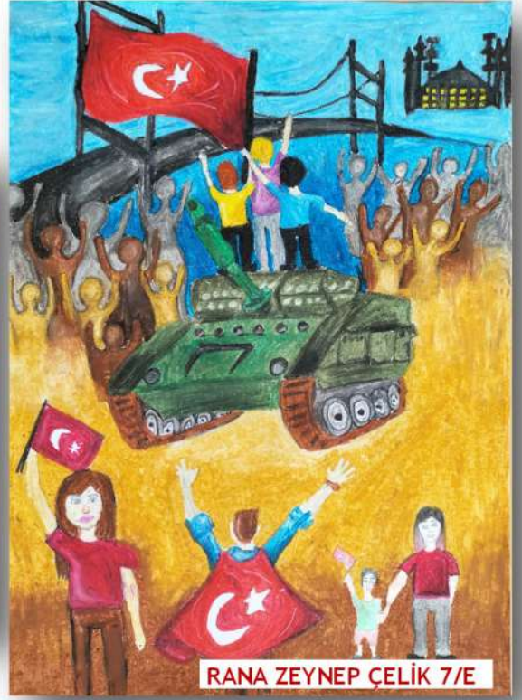
RANA ZEYNEP ÇELİK 7/E