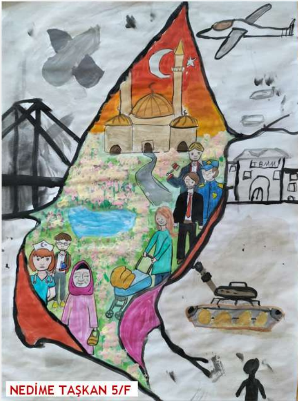
NEDİME TAŞKAN 5/F